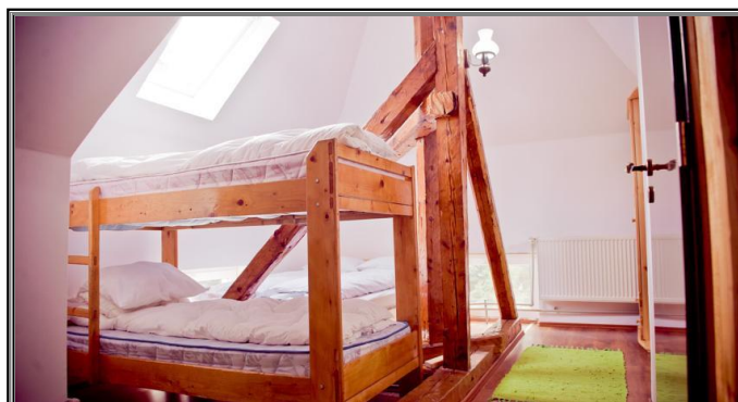
Imagini Cabana Cetățile Ponorului